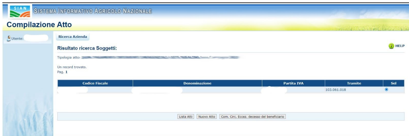
Figura 6 - Pagina di visualizzazione soggetto