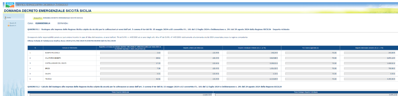
Figura 14 - Pagina di visualizzazione quadro B

Il quadro B sarà accessibile solo in visualizzazione poiché i dati sono caricati in maniera antecedente la domanda stessa.