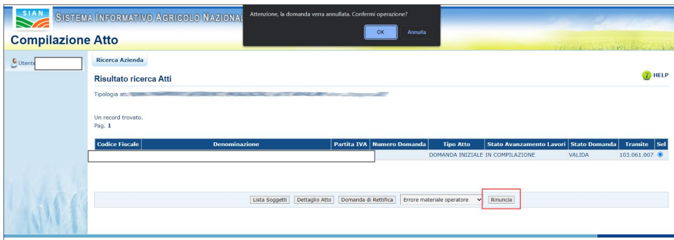
Figura 8 - Rinuncia Domanda

La rinuncia alla domanda comporta l'annullamento della domanda precaricata e l'impossibilità di accedere all'aiuto.