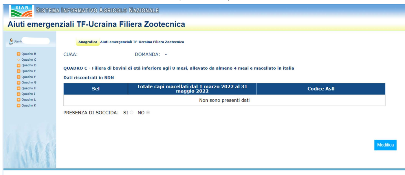
Figura 5 - Inserimento quadro Quadro C

In caso di assenza di dati forniti da BDN, non sarà possibile compilare il form.