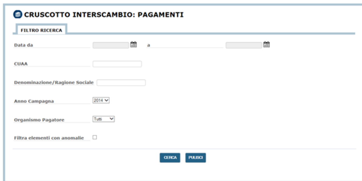
Figura 10 - Ricerca Pagamenti