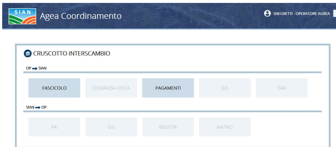
Figura 1 - Menu dell'applicazione